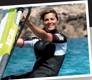
Nathalie Simon, Championne de planche à voile et présentatrice de télévision

“ Mon expérience des sports nautiques m’a appris à être très exigeante en matière de protection solaire. Ma peau doit rester protégée en toutes circonstances, même lorsque je pars plusieurs heures sur l’eau.